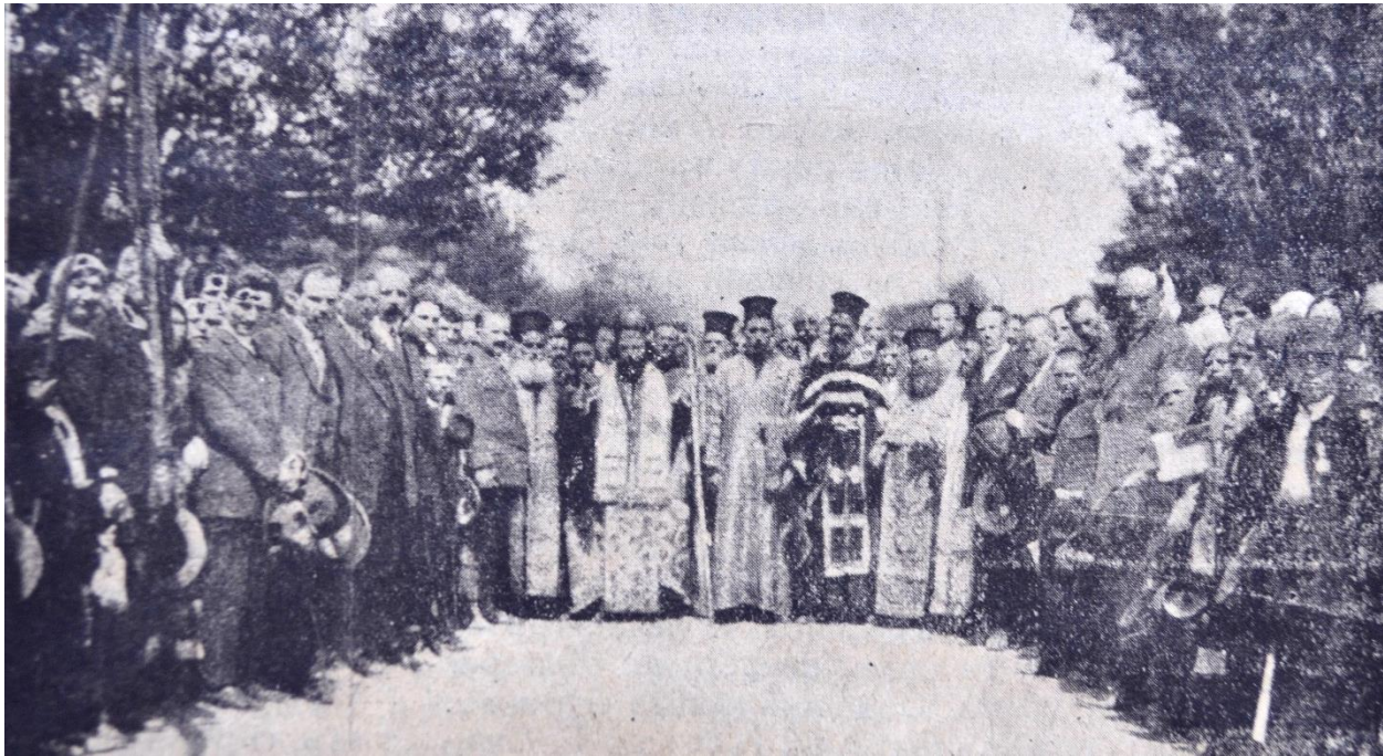
Панихида за Западнопокрайните невинни жертви отслужена от свещеници на Българската екзархия 1925 г. Стрезимировци на протестния събор

Бог да ви прости, мили братя! Простете и на нас. И дано Бог да пази България!