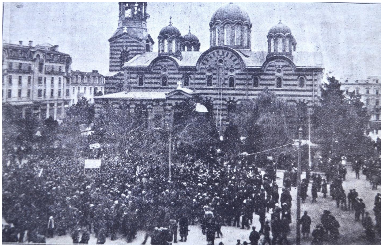
Протест срещу окупацията на Западните покрайнини и молебен за жертвите от тези краища на 8 ноември 1923 г. София, църквата Св. Неделя/Св. Крал Ден на Западните покрайнини

Трябва ли да се споменава мерзостта на „свободното изкуство“ в София днес да прекатури истината и със собствените си ръце и съвест да представя в светинята на Българския дух Народния театър едно скудоумие с надменност и дебелация на простотията издевателството с най-святото дело на Нова България – Апотеозът на нашето национално единство и достойнство – Защитата на България в окопите на Сливница през 1885 г. И пак – елитите и институциите мълчат и бездействат.