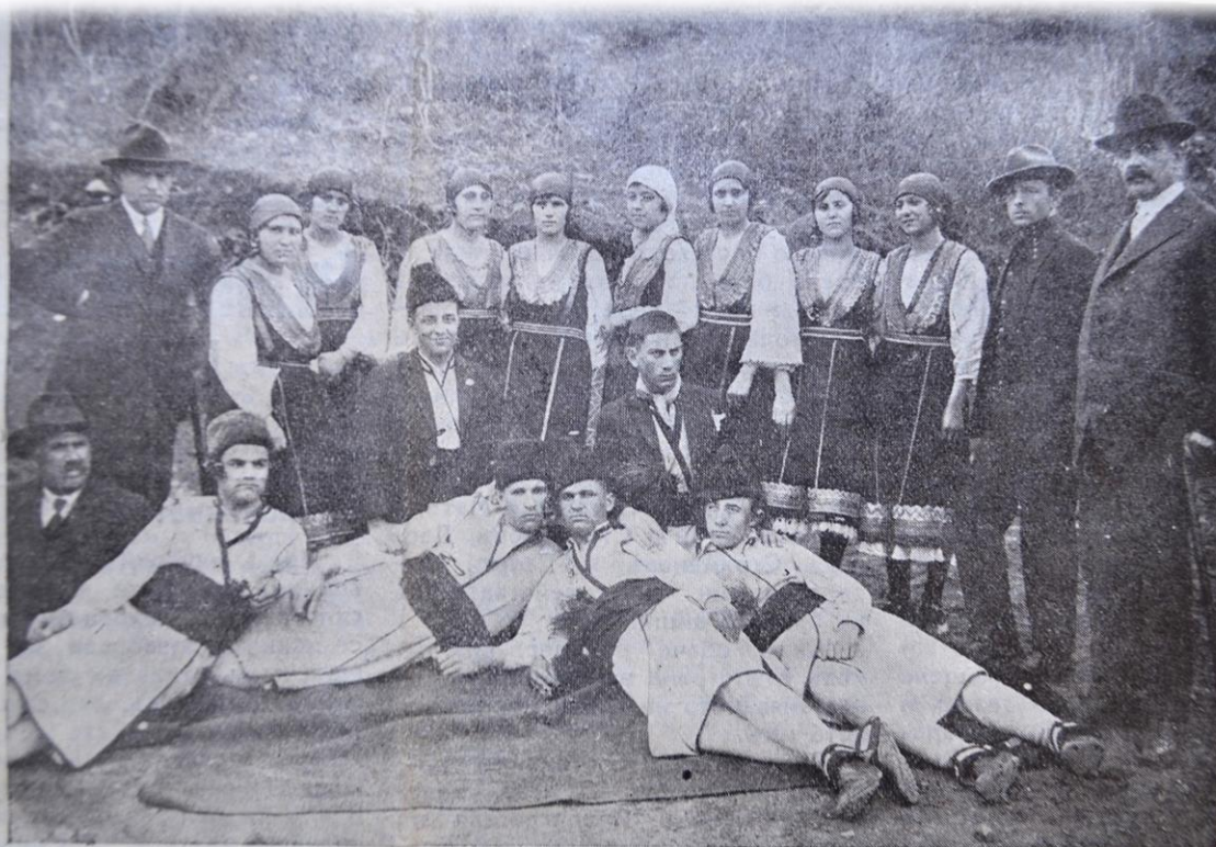
Група ученици и учители от трънската см. гимназия, бѣжанци отъ Запад- нитѣ покрайнини, по случай дадената отъ тѣхъ забава на 12 мартъ за въ- полза на вестникъ „Западно Ехо“.

усилия и средства на властите, да бъдат маргинализирани и демонизирани свободните изяви на Българска национална самоличност от нашите сънародници от Западните покрайнини и в Северна Македония, ние сме свидетели на небивал стоицизъм и национално достойнство от хора, които доброволно и съзнателно отхвърлят унижителното приспособяване. За тях е нашето преклонение и почит.