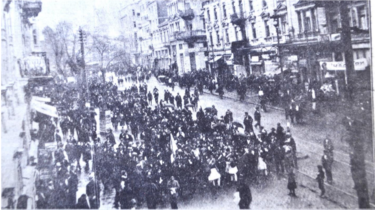
Манифестацията по ул. „Мария Луиза“ към бѣжанския домъ

8 Ноември - Деня на Западните покрайнини